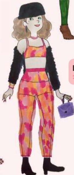
Line, 12 ans