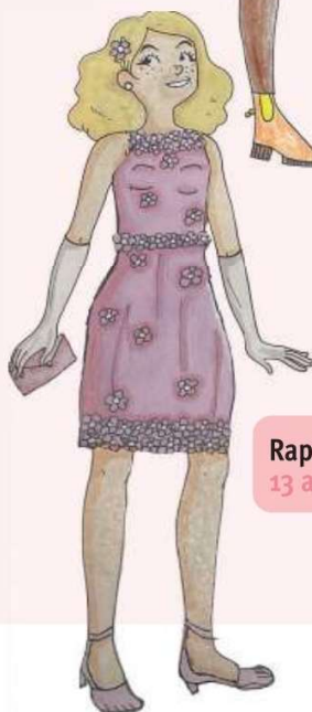
Raphaëlle, 13 ans