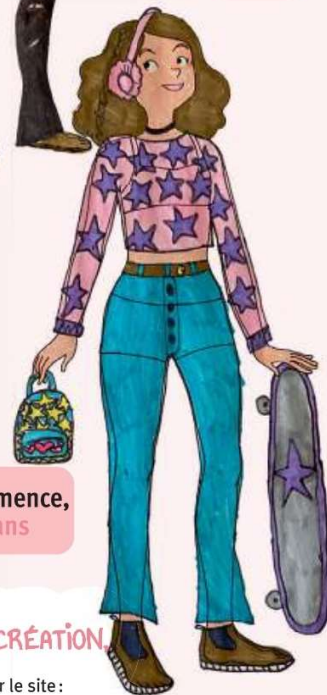
Clémence, 10 ans