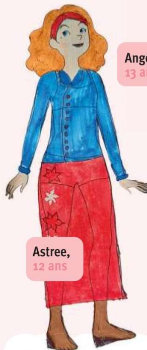
Astree, 12 ans