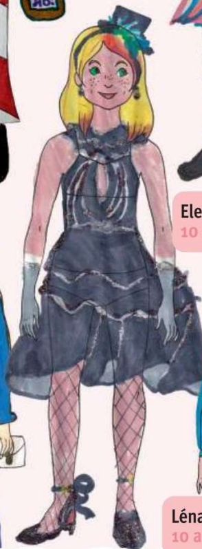
Elea, 10 ans