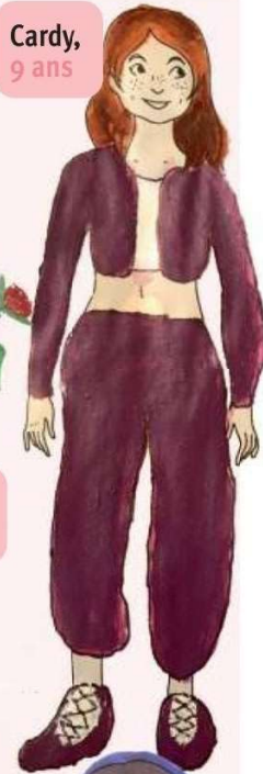
Cardy, 9 ans