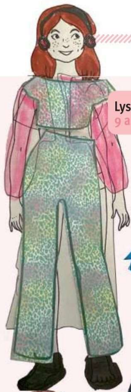
Lyssia, 9 ans