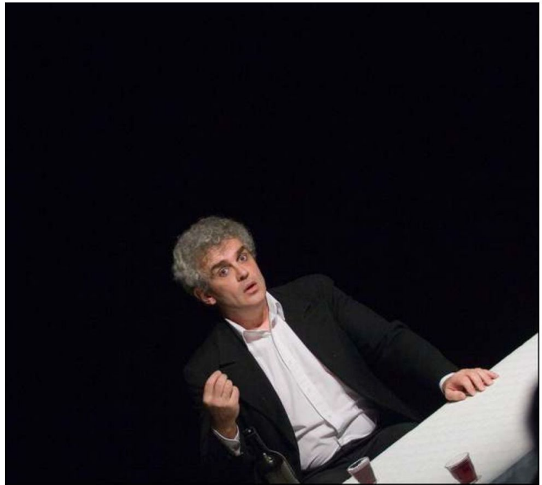
Trois artistes, trois seuls en scène dans trois lieux patrimoniaux remarquables pour la première édition de la Nuit des Soli.